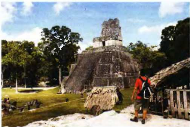
Η ιστορική μητρόπολη των Μάγια στην καρδιά της Γουατεμάλας