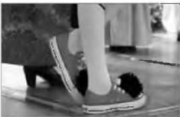
«Σταρόκιο»... με φρόντα! Μια νότα ελληνισμού στο Μεξικό

• Και με τους «χαμένους Έλληνες»; Πώς τους εντοπίζετε; - «Όποιος γυρίζει, μυρίζει. Αυτή είναι η βασική μου αρχή. Ξέρω ότι σε κάθε περιοχή σίγουρα υπάρχει κάποιος χαμένος Έλληνας. Ψάχνω, ρωτώ και πολλές φορές με βοηθά και η τύχη. Ζητώ τη βοήθεια των τοπικών ΜΜΕ που πραγματικά μου συμπεριφέρονται και με βοηθούν. Μέχρι σήμερα περισσότερα από 200 εφημερίδες, ραδιοφωνία και τηλεοπτικές σταθμούς στη Λατινική και Κεντρική Αμερική έχουν αναφερθεί στην προσπάθειά μου. Και οι άνθρωποι ανταποκρίνονται. Υπάρχουν πολλοί που ψάχνουν να βρουν τις ρίζες τους γιατί ο παππούς τους ήταν Έλληνας, γιατί έχουν ελληνικό επίθετο. Η αναζήτηση χαμένων Ελλήνων είναι μια πρόκληση για μένα. Θεωρώ ότι εκπληρώνω μια αποστολή ως Έλληνας. Δεν μου το ζήτησε κανένας, αλλά μου το έβγαλε η ψυχή μου στην πορεία. Επιστρέφω όλες τις γνώσεις μου και όλες τις δυνάμεις μου. Οραλολόγ ότι είναι πολύ δύσκολο. Ειδικά στην αρχή που δεν ήξερα τη γλώσσα. Τώρα είναι ευκολότερο μιας και όλοι μιλάνε ισπανικά σε αυτό το κοι-