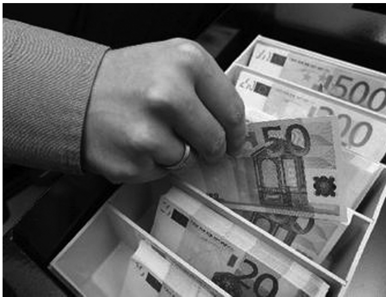
Οι ανείσπρακτες οφειλές προς το δήμο μετά την πάροδο πέντε ετών παραγράφονται

Περί τους 50 είναι οι οφειλές προς το δήμο Καβάλας που με βάση το νόμο πρέπει να διαγραφούν οι οφειλές τους προς το δήμο Καβάλας από παρελθόντα έτη. Οι περισσότερες περιπτώσεις αφορούν σε επαγγελματίες οι οποίοι είτε ανέστειλαν τη λειτουργία των επιχειρήσεών τους είτε περιήλθαν σε πτώχευση, δίχως όμως προηγουμένως να καταβάλλουν τα τέλη παρεπιδημούντων στο δήμο Καβάλας. Ουσιαστικά στον προϋπολογισμό εμφανίζεται ως απαιτητό ποσό το ποσό των 350.000, που όμως δεν πρόκειται να εισπράξει ο δήμος Καβάλας, αφού αφορά σε χρέη που βεβαιώθηκαν ακόμη και από το